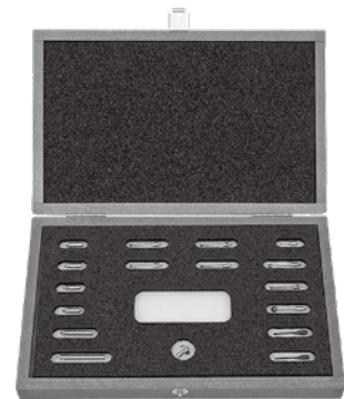
写真は②スタイラスキットM2

※プレゼント②は数に限りがございます。なくなり次第、プレゼント①のみとなります。