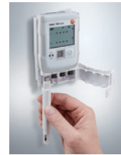
デジタルプローブ装着例