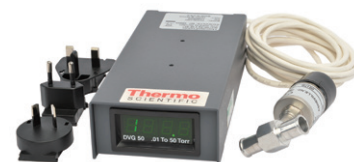
DVG50-UNV デジタル真空ゲージ