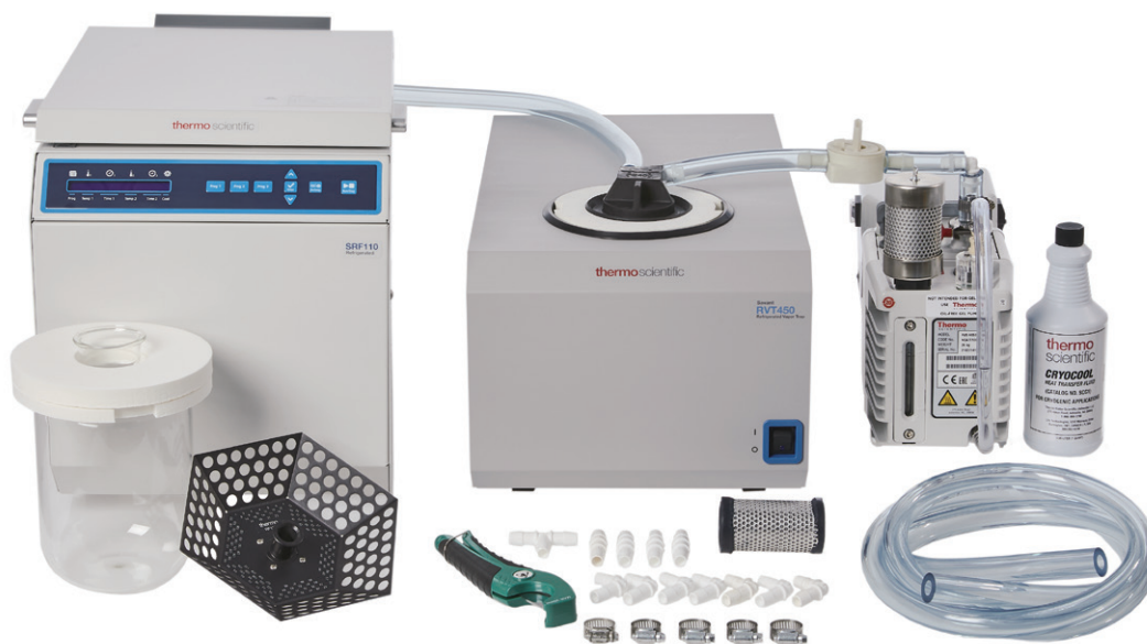
SpeedVac SRF110 冷却遠心濃縮装置 構成A