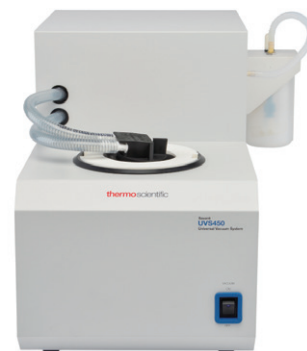
UVS450-115真空冷却トラップ および ANT100Sポストトラップアセンブリー